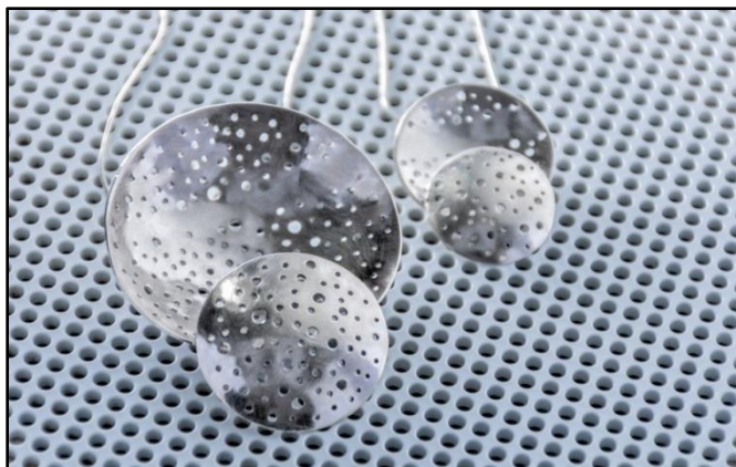
COLAR FU 01 tamanho G(6,5cm/ foto) COLAR FU 02 tamanho P (3,5 cm) prata, corrente 60 cm G-RS 500,00 / P-RS 420,00