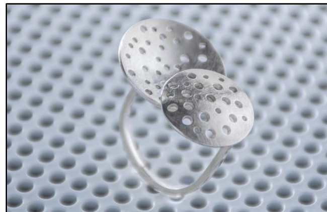
ANEL AJUSTAVEL FU 03 (foto) prata RS 350,00