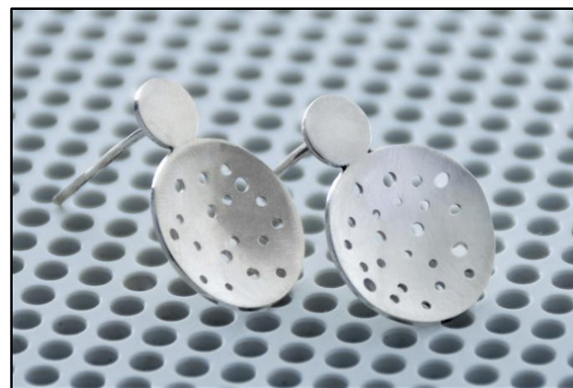
BRINCO PEQUENO FU 05 (2,2cm), prata, RS 290,00,