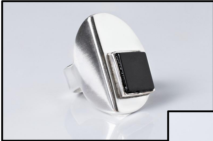
ANEL AJUSTAVEL ONI 01 (2,5cm), prata, onix RS 450,00