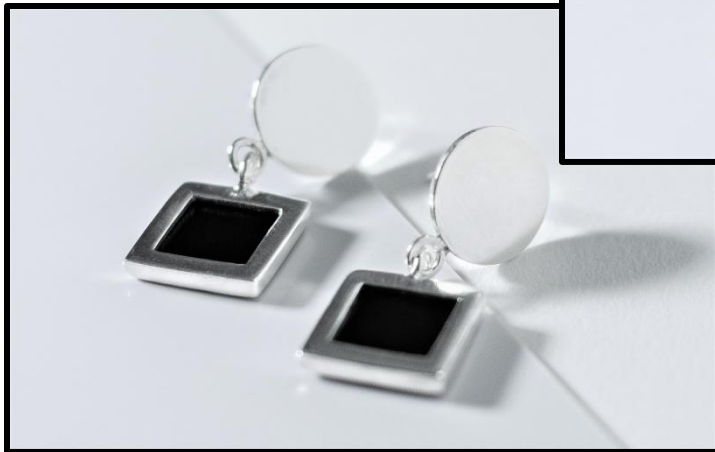
BRINCO M ONI 03 (3,3cm) prata, onix RS 330,00