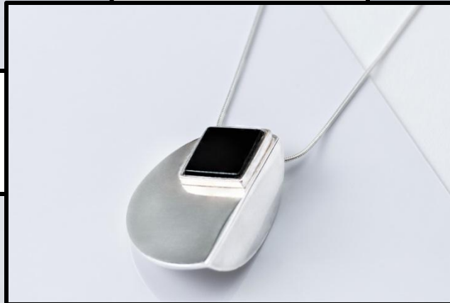
COLAR 05 prata, onix, (2,5cm), corrente 60 cm, RS 450,00