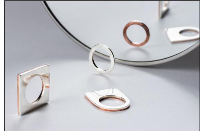
ANEL UNI02 RS 270,00 CADA (redondo, quadrado, forma) prata , cobre