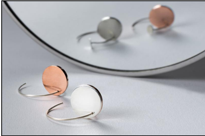
BRINCO UNI01 RS 290,00 (4cm), prata, cobre