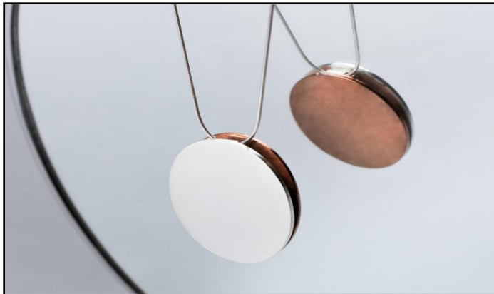
COLAR UNI03 RS 390,00 ( \varnothing 3 cm), corrente 60 cm, prata, cobre